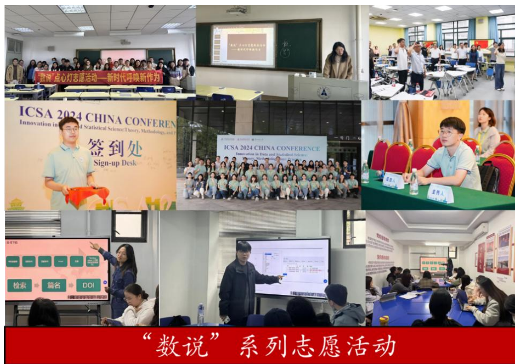
图6 博士支部举办“数说”系列志愿活动

动，对本科生解答统计专业问题，为存在发展困惑的师弟师妹提供一定的建议。开展研究生学术论文指导研途微沙龙活动，为研究生师弟师妹详细讲解文献搜索与整理、论文写作的知识和技巧。博士党员还担任学科相关重要会议主要志愿者。通过这些活动，培养了博士党员严于律己、勇于奉献的精神，同时也鼓励师弟师妹立报国强国大志向、做挺膺担当奋斗者。