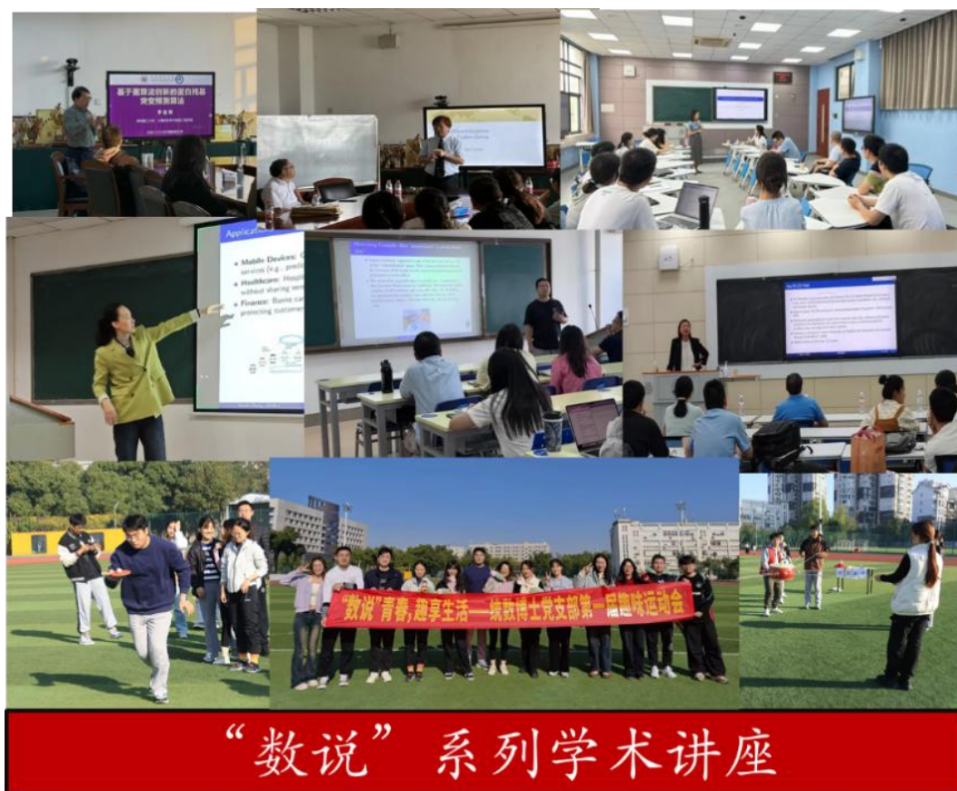
图 5 博士支部依托学院举办“数说”系列讲座

举办“数说”系列学术讲座。党支部依托学院邀请统计学领域专家聚焦热点问题，为博士生提供系列讲座近 30 次。讲座内容涵盖非参数检验、最优估计、机器学习、生存分析、投资组合、复杂网络等目前国家重点关注领域，拓宽博士生发展视野。并注重德智体美劳全面发展，举办趣味运动会。