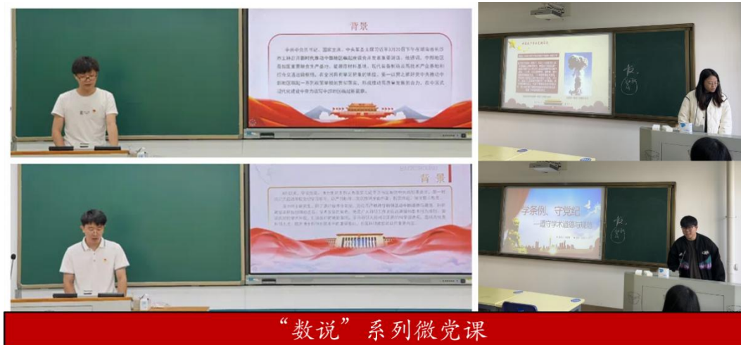
图 4 党员代表作“数说”系列微党课学习分享

举办“数说”系列学术讲座。党支部依托学院邀请统计学领域专家聚焦热点问题，为博士生提供系列讲座近 30 次。讲座内容涵盖非参数检验、最优估计、机器学习、生存分析、投资组合、复杂网络等目前国家重点关注领域，拓宽博士生发展视野。并注重德智体美劳全面发展，举办趣味运动会。