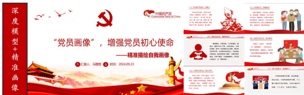
图1 2024年9月23日支部党员在线上开展“精准画像”活动

支部组织博士党员利用调查问卷进行政治体检，通过自省、互省、深度模型分析等方式及时发现自己的问题和不足。同时，利用深度模型分析总结出博士党员存在的普适性问题，并总结为“六种画像”，不断增强博士党员政治敏锐性和政治免疫力。